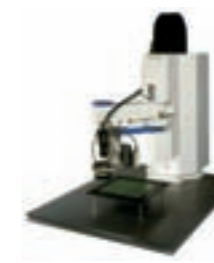
CCD CÁMARA Y SENSOR