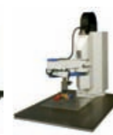
PICK & PLACE